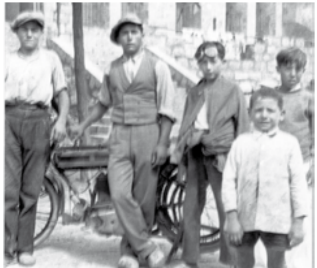
Grup de gent (desconeguts) a les escales del castell