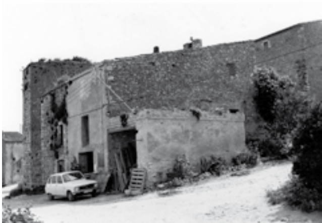
Fusteria Gifre darrera el castell anys 70